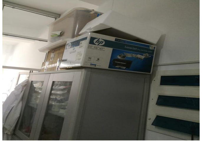
▲北楼 200 西