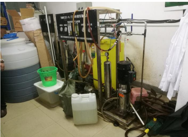
▲北楼 113 西