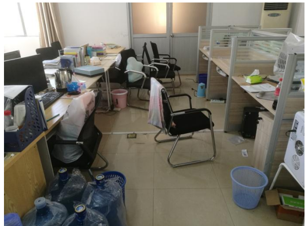
▲嘉锡楼 314 南