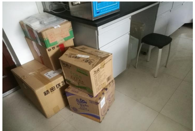
▲北楼 200 西