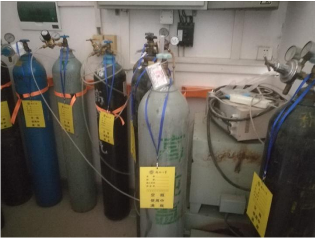
▲北楼 109 气瓶未及时退换