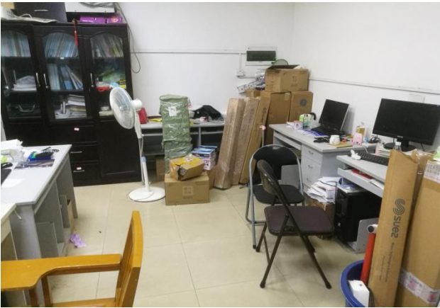
▲北楼 113 西