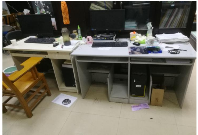
▲北楼 113 西