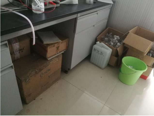
▲北楼 200 西